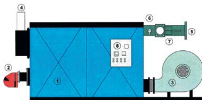
Рис. 1. Схема генератора горячего воздуха SIMUN

Отработанные и остывшие дымовые газы с температурой около 50-60°C из теплообменника выбрасываются в атмосферу через выпускную трубу (рис. 1 поз. 4). На выходе из камеры нагрева установлены датчик температуры горячего воздуха (рис. 1 поз. 6) и предохранительный клапан (рис. 1 поз. 7). Все приборы контроля и управления