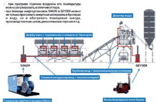
Рис. 5. Вариант расположения Simun и Geysер на бетоносмесительном заводе

димо только выключить установку — и все! Не надо продувать всю систему от остатков воды, как на парогенераторах и турбогазовых установках, или переводить ее в спящий режим;