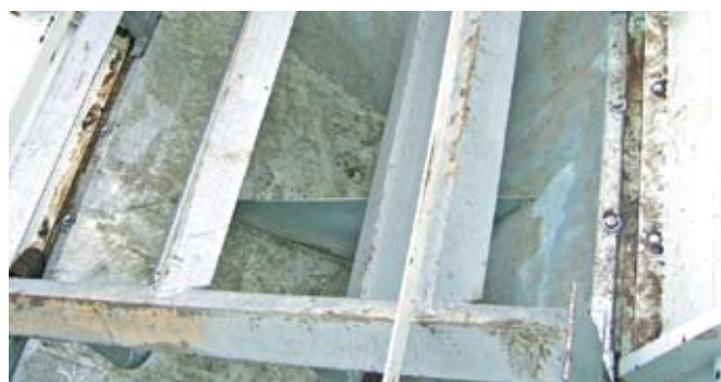
Рис. 3. Диффузоры (фото изнутри одного отсека)

энергоустановкой смонтированы на панели управления (рис. 1 поз. 8). На рис. 2 показана система присоединения главного трубопровода к бункерам инертных материалов, на этом же рисунке видно, где устанавливаются клапаны для регулировки подачи воздуха в диффузоры бункеров инертных материалов. Клапаны могут быть как с ручным, так и с автоматическим приводом.