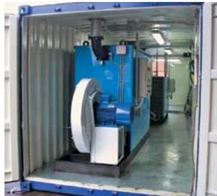
Рис. 4. Вид оборудования при расположении в контейнере

- при простоях бетоносмесительного завода зимой затраты на содержание генераторов SIMUN сводятся к нулю. Необхо-